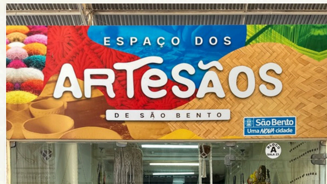
As Artesãs do Shopping das Redes: Mulheres que transformam fios em arte, compartilhando a técnica e a criatividade que tornaram São Bento a capital mundial das redes.